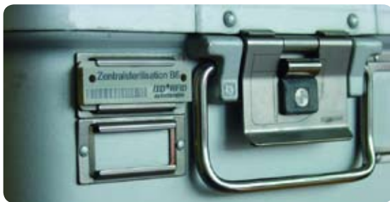
Direkt am Sterilisationscontainer lässt sich der Elmi-Tag anbringen.

Stetig steigende Kosten und wachsende Anforderungen an die Qualität der Behandlung und rechtliche Rahmenbedingungen im Gesundheitswesen lassen der Frage des nachvollziehbaren Lebenszyklus von chirurgischem Instrumentarium wie OP-Bestecken und Sterilisationscontainern eine besondere Bedeutung zukommen. Der Elmi-Tag weist eine besondere RFID-Transponderbauform auf, die sich zur direkten Anbringung an Sterilisationscontainern eignet. Das robuste und sterilisationssichere Packaging ist für den täglichen Einsatz geeignet. Mit dem Transponder lassen sich Abläufe im Gesundheitswesen sowohl beim Anwender in der Praxis, im Krankenhaus, aber auch beim Dienstleister automatisiert durch RFID-Erfassung realisieren. Eine weltweit eindeutige Seriennummer nach HIBC UIM-Standard sorgt neben der transpondereigenen UID-Nummer für unverwechselbare Identifikation.